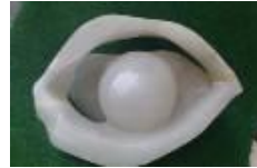
Auge, 2006 Alabaster Limit: 450,- Euro