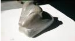
Hase , 2013 Speckstein Limit: 30,- Euro