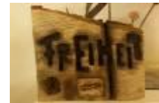
Freiheit, 2012 Holz geflammt Limit: 100,- Euro