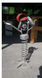
Ohne Titel , 2013 Collage, Metall, Acryl, Limit: 250,- Euro