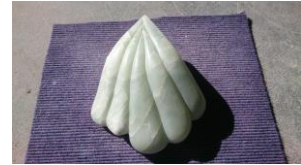
Muschel , 2014 Speckstein Limit: 90,- Euro