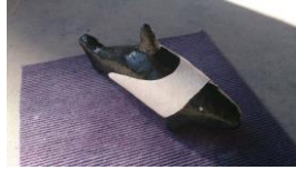
Orca 2014 Ytong, Acryl Limit: 30,- Euro