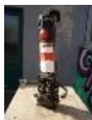
Clown , 2010 Holz, Metall, Acryl Limit: 350,- Euro