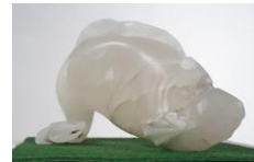
Fisch, 2006 Alabaster Limit: 800,- Euro