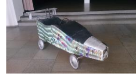
Seifenkiste , 2004 u.2014 CD's Holz, Metal etc. Privatbesitz der Werkstatt