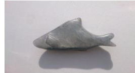
Fisch , 2014 Speckstein Limit: 20,- Euro