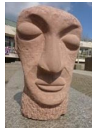
Kopf, 2001 Sandstein Privatbesitz