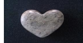
Herz , 2014 Speckstein Limit: 60,- Euro