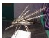
Insekt , 2011 Schrott, Metall Limit: 190,- Euro