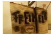
Freiheit, 2012 Holz geflammt Limit: 100,- Euro