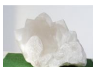
Drache , 2005 Alabaster Limit: 200,- Euro