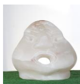
Buddakopf , 2005 Alabaster Limit: 250,- Euro