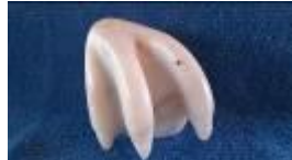
Vogelkralle , 2013 Speckstein Limit: 60,- Euro