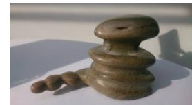
Schlange, 2013 Speckstein Limit: 40,- Euro

Bitte beachten Sie, dass alle Skulpturen im Rahmen unserer Auktion am Sonntag, den 31. August zu Gunsten der Kunsttäter versteigert werden.