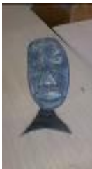
Kopf, 2013 Speckstein, Metall Limit: 120,- Euro