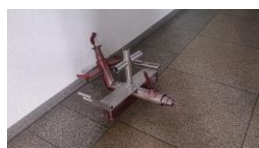
Flugzeug , 2014 Metall, Fundstücke, Acryl Limit: 150,- Euro