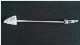
Pfeil , 2014 Speckstein, Metall Limit: 50,- Euro