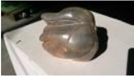
Affenkopf , 2013 Speckstein Limit: 50,- Euro