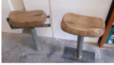
Stuhlgruppe , 2012/13 Walnuss, Metall Limit: 1.400,- Euro