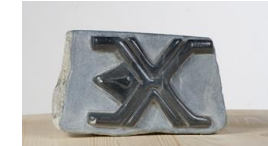
Spinne , 2008 Speckstein Limit: 55,- Euro