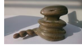
Schlange, 2013 Speckstein Limit: 40,- Euro