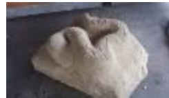
Schlange, 2012 Sandstein Limit: 250,- Euro