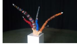
Licht 2 , 2012 Buchsbaum, Metall, Acrylglas Limit: 1.500,- Euro