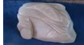
Ohne Titel , 2013 Speckstein Limit: 60,- Euro