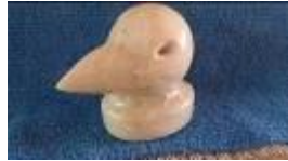
Vogelkopf , 2013 Speckstein Limit: 50,- Euro