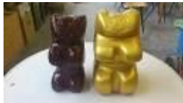
2 Gummibärchen, 2012 Ytong, Acryl Limit: 140,- Euro