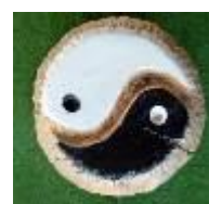
Yin & Yang , 2012 Holz, Acryl Limit: 100,- Euro